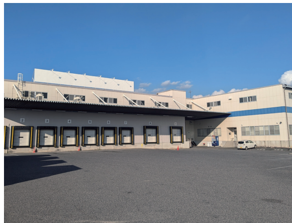
▲ 春日井低温センター（外観）

2025年1月20日からは、新たに三重県及び愛知県尾張西部エリアの物流を受託し、「一宮低温センター」「春日井低温センター」「岡崎低温センター」の3拠点にて大手ドラッグストアの中部地区約460店舗に商品をお届けしております。今後も効率的な物流運営を図り、より一層お取引先様の信頼に応えるため、最適な物流を実現してまいります。