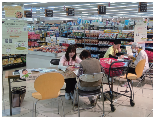
▲ 店頭での啓蒙イベントの様子

今後も地域社会に根ざした活動を通じて、健康的な食生活に貢献できるよう、尽力してまいります。