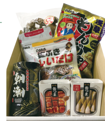
画像は 3,000 円相当 (例)